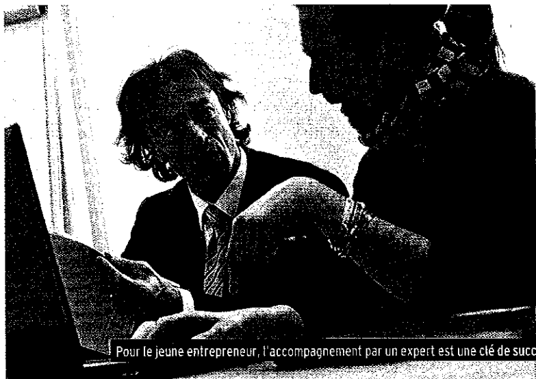
Pour le jeune entrepreneur, l'accompagnement par un expert est une clé de succès.